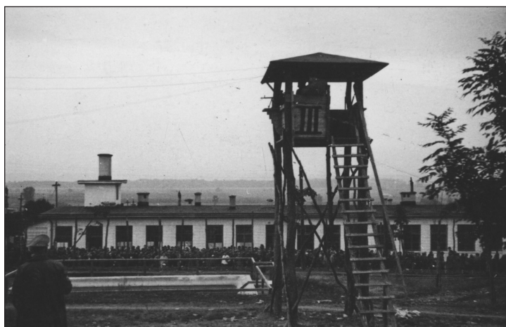
1939 auf österreichischem Gebiet errichtetes Lager für polnische Kriegsgefangene/Zwangsarbeiter, undatiert.

Rassismus prägte das Verhältnis zu den ausländischen ArbeiterInnen: PolInnen und Angehörige der Sowjetunion unterlagen jeweils eigener Gesetzgebung und wurden viel schlechter behandelt und härter bestraft als WesteuropäerInnen. Für die Gestapo stellten die ZwangsarbeiterInnen ein Sicherheitsproblem dar. Kontakte zwischen ihnen