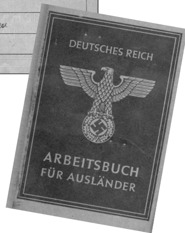
Arbeitsbuch einer jugendlichen „Ostarbeiterin“